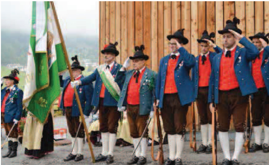
Die Welschtiroler Ehrenkompanie von Telve aus dem Valsugana