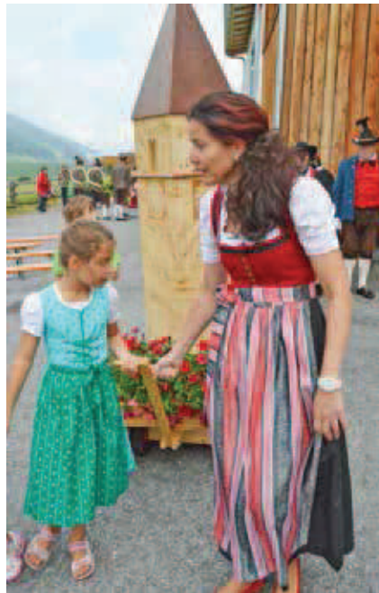
Bereit zum Festumzug