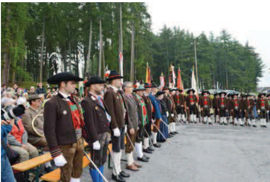
Fast alle stramm gestanden